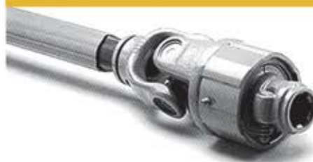
کلاج جفجغه‌ای RATCHED TORQUE LIMITER