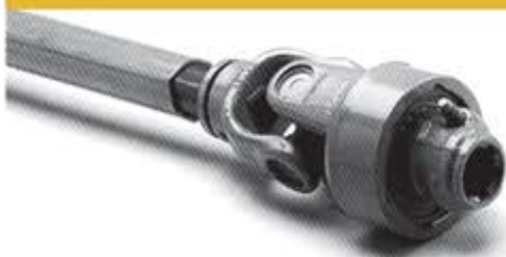
کلاج یک طرفه OVERRUNNING CLUTCH