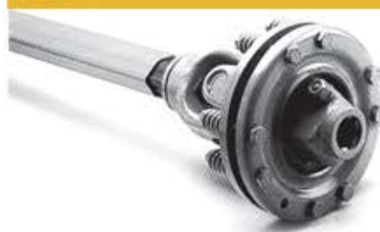
کلاج اصطکاکی FRICTION TORQUE LIMITER