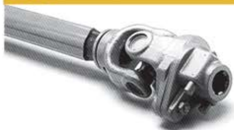
پیچ برشی محدود کننده گشتاور SHEAR BOLT TORQUE LIMITER